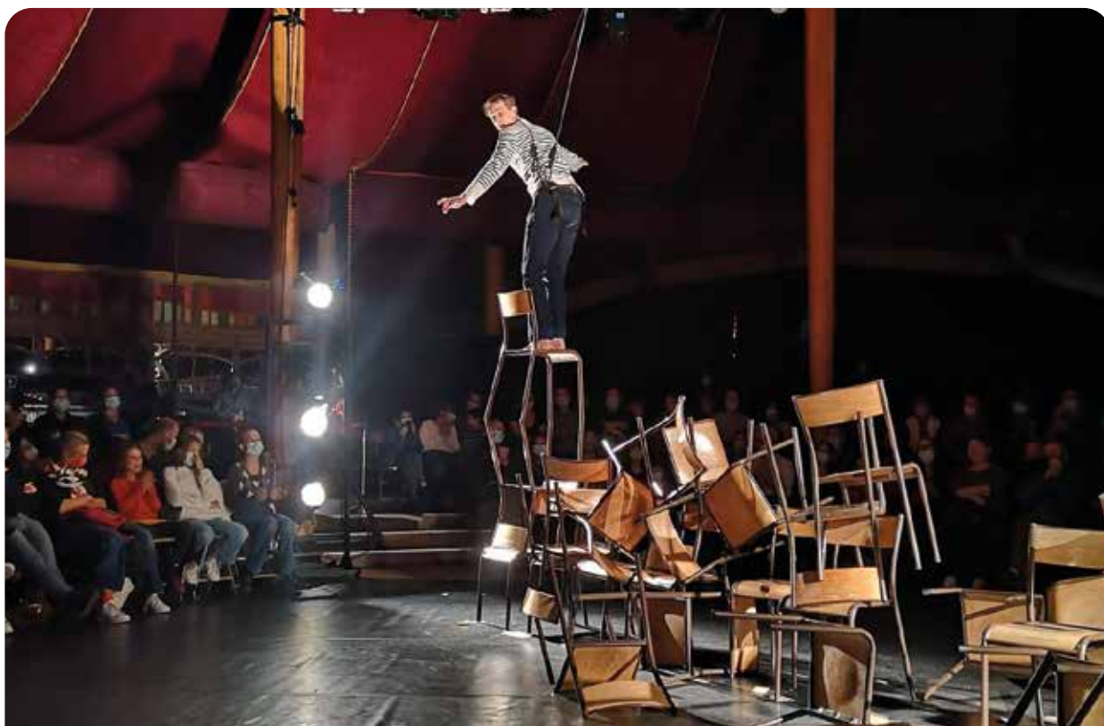
L'âne et la carotte de la compagnie Galapiat Cirque / Lucho Smit