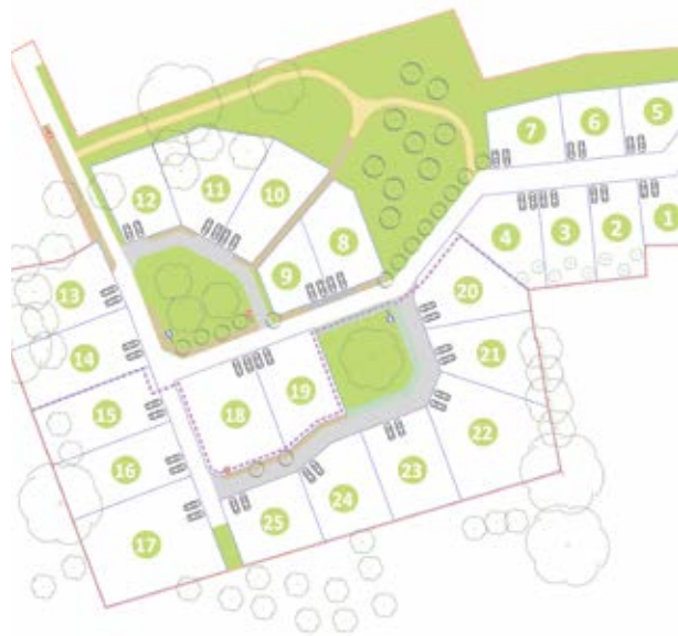
NYOISEAU Lotissement rue Haute