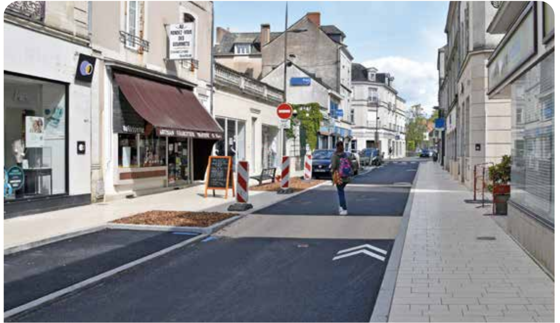
La rue Victor Hugo est à nouveau ouverte à la circulation.